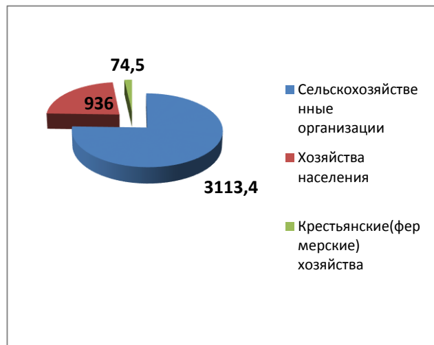
Рис. 2. Валовый сбор винограда РФ, тыс.ц

В современных условиях развития АПК роль крестьянских (фермерских) хозяйств, личных подсобных хозяйств и других малых форм предпринимательства нельзя переоценить в обеспечении роста производства экологически чистой, конкурентоспособной сельскохозяйственной продукции.